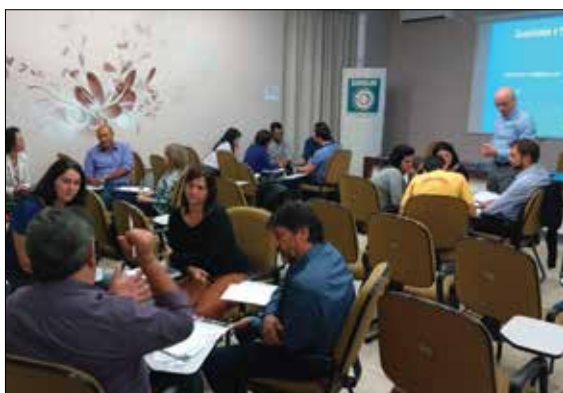
Workshop Qualidade e Produtividade

Os dois cursos realizados em agosto tiveram boa avaliação dos participantes. Confira!