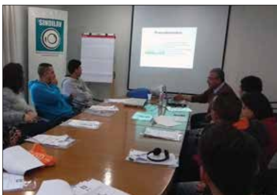
Curso de Primeiros Socorros

Seguindo com a premissa de oferecer sempre o melhor para os seus associados – incluindo o aprimoramento profissional de gestores e o treinamento dos trabalhadores de lavanderias –, continuamos com a nossa agenda de 2017 oferecendo cursos gratuitos, com material didático e, principalmente, informação relevante para os participantes.